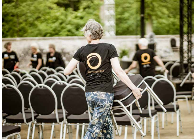
Vrijwilligers in actie

Oranjewoud Festival is een lerende organisatie. Van vrijwilliger tot teamlid, iedereen die werkzaam is bij het festival krijgt de kans zich te ontwikkelen, meer verantwoordelijkheden te dragen en zo invloed uit te oefenen op de gang van zaken. Zo werd onze marketing-assistent later ook hoofd kaartverkoop en promoveerde onze vervoerscoördinator tot Hoofd vrijwilligers. Sommige teamleden zijn ooit begonnen als vrijwilliger. Dit doorstromingsbeleid draagt bij aan een brede kennis en ervaringsopbouw van teamleden. Zij kunnen nieuwe collega's in 'hun' oude functies coachen of opleiden tot hun eigen functie. Ook wordt de organisatie van onder af diverser. Voor scholing is een beperkt budget gereserveerd.