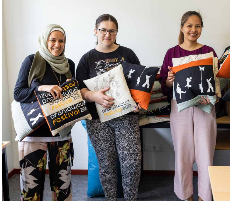
AZC Burgum | Foto Lucas Kemper