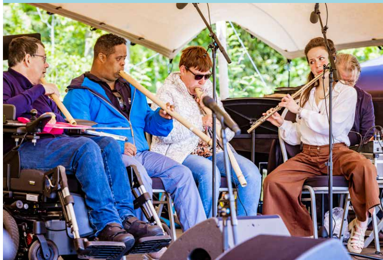
Onbeperkt Ensemble

Participatie betekent voor ons dat iedereen moet kunnen meedoen, ook mensen in geïsoleerde posities. Het Onbeperkt Ensemble is jaarlijks te gast op het festival. Deze groep bestaat uit professionele musici en mensen met een verstandelijke beperking, geleid door muziektherapeut Stephan Mooibroek. Hij opereert vanuit de visie dat muzikale expressie een universeel talent is, los van fysieke en mentale capaciteiten.