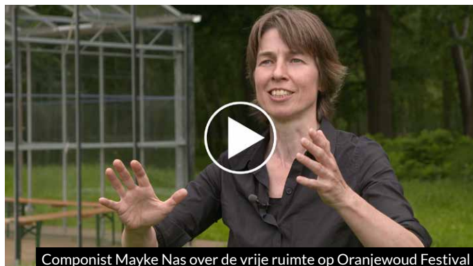
Componist Mayke Nas over de vrije ruimte op Oranjewoud Festival

Deze makers wordt vrije ruimte geboden voor onderzoek en experiment door middel van opdrachten, residenties en andere vormen van ondersteuning, verspreid over meerdere edities. Hiermee profileert Oranjewoud Festival zich als de kraamkamer van nieuwe muzikale ontwikkelingen. Veel in Nederland werkzame componisten zien het als een van de belangrijke nieuwe-muziekfestivals, dat nieuw gecomponeerd muziek bovendien ontsluit voor een breed publiek.