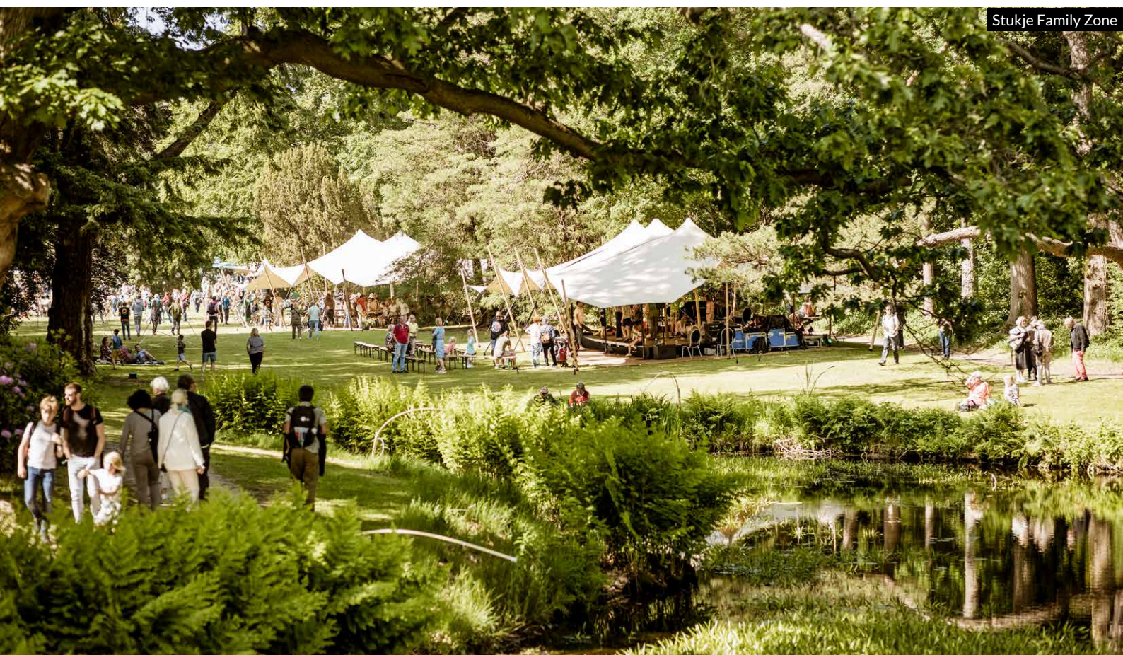
Stukje Family Zone

Indirecte ondersteuning vinden wij bij de lokale leveranciers die de recente kostenstijgingen slechts beperkt doorberekenen vanwege de goede relatie. Naast de coulance van de gemeente rekt IJss Stadion Thialf een vriendenprijs voor de huur van opslagruimte. Veel lokale bedrijven en partners nemen arrangementen af bij het festival en Parkhotel Tjaarda verricht hand- en spandiensten tijdens het festival. Andersom zorgt het festival voor veel omzet bij de lokale middenstand door deelname aan De Proeftuin. Ook lokale leveranciers, hotels en andere accommodaties profiteren flink van het festival.