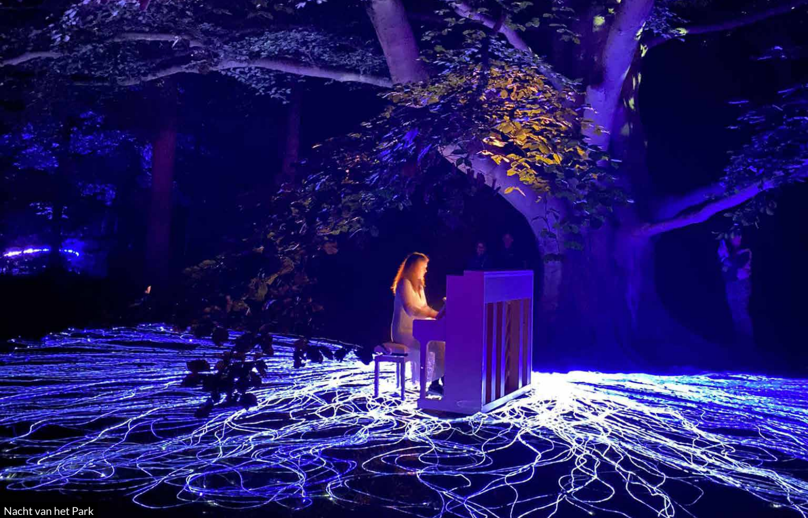
Nacht van het Park