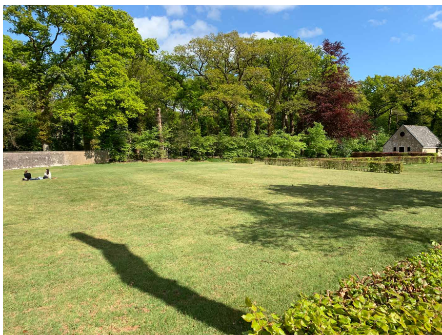
Een vrijwel verlaten Overtuin

Het programma van editie 2021 bevindt zich reeds in een gevorderd stadium. Behalve een aantal onderdelen dat gepland stond voor 2020 wordt ruimte geboden aan nieuwe spannende projecten. 2021 markeert ook het begin van een nieuwe vierjarige kunstenplanperiode. Aanvragen voor meerjarige financiële ondersteuning zijn ingediend bij het Fonds Podiumkunsten en de provincie Fryslân. Indien toegekend zal dat het festival naar verwachting een nieuwe impuls geven zodat wij ons groeiende publiek ook de komende jaren in aanraking kunnen brengen met fantastische musici en unieke programma's waar Oranjewoud Festival bekend om staat.